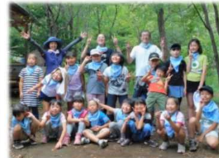
ロッジ水野の森で野外活動

【対象】地域の小学生 【定員】30名 【費用】1,000円（教材費ほか） ※内容により別途実費徴収あり 【場所】水野公民館1階 ホール 【申込み】先着順。4月25日（土）9：00～ 水野公民館に電話 Tel2958-7991