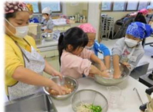
肉まんづくりに挑戦中