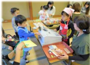
お買い物ごっこで交流

【日程】5月14日（木）～来年3月 原則毎週木曜日10：30～12：00 【内容】工作・手あそび・イベント・調理等