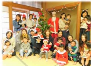
クリスマスパーティー

【対象】未就園児とその母親 【定員】20組 【費用】1,000円（教材費ほか） ※活動内容により別途実費徴収あり 【場所】水野公民館2階 和室 【申込み】先着順。4月23日（木）9：00～ 水野公民館に電話 Tel2958-7991