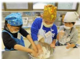
21日(土)おもしろ教室：肉まんづくりに挑戦！おいしい熱々の肉まんが完成しました