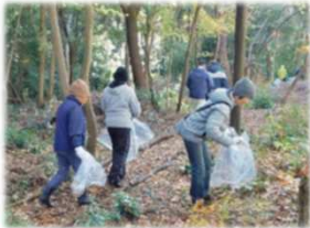
1日(日)水野の森クリーン作戦：武蔵・若葉台・三葉台、3自治会共催の清掃活動♪