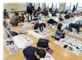
25日(水)書き初め学習会：月見野書道会が小学3～6年生に書き初め指導をしました