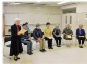
14日(土)平和朗読会：金子みすゞを読む会の協力で実施。平和について考えました