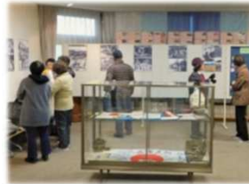
5日～14日 平和メッセージギャラリー