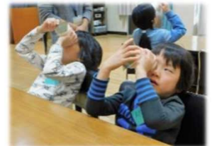
15日(日)不思議な光の科学実験教室