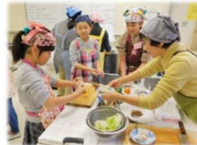
7日(土)小学生里芋料理教室：狭山特産の里芋を使ってカレーやビスケットを調理！